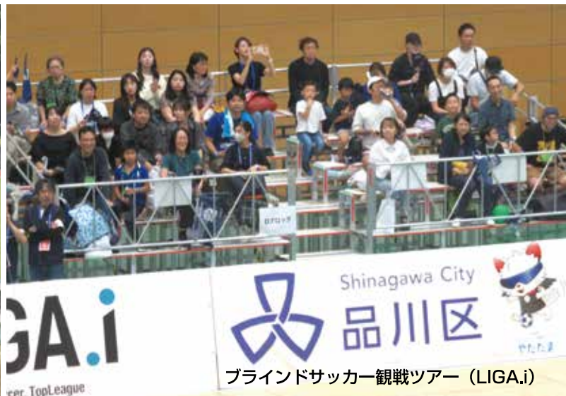
ブラインドサッカー観戦ツアー (LIGA.i)