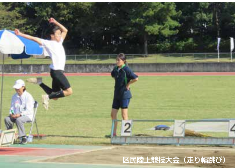
区民陸上競技大会 (走り幅跳び)