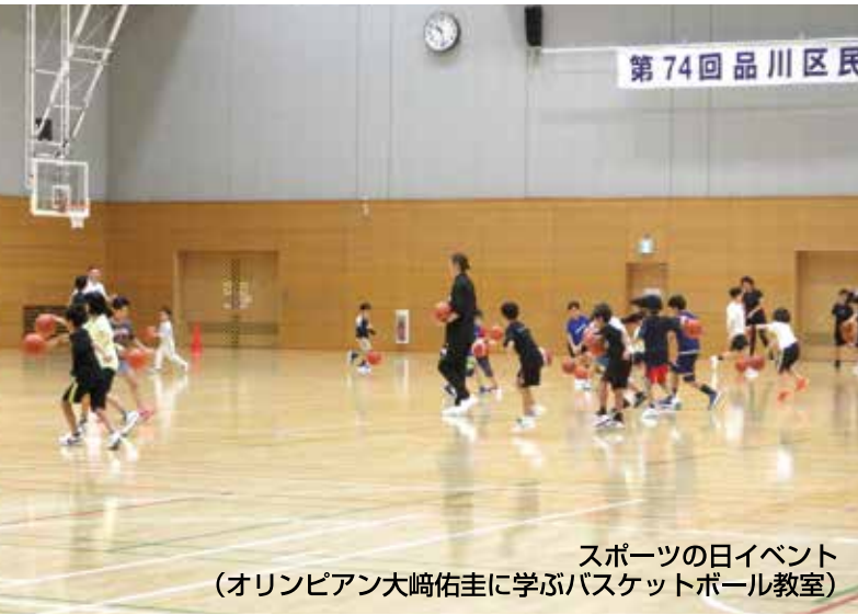
スポーツの日イベント (オリンピック大崎佑圭に学ぶバスケットボール教室)

公益財団法人品川区スポーツ協会は、品川区におけるスポーツ及びレクリエーションの普及、振興を図り、誰もが気軽にスポーツを楽しめる機会を提供し、区民の心身の健全な発達と明るく豊かな地域社会の形成に寄与することを目的としています。