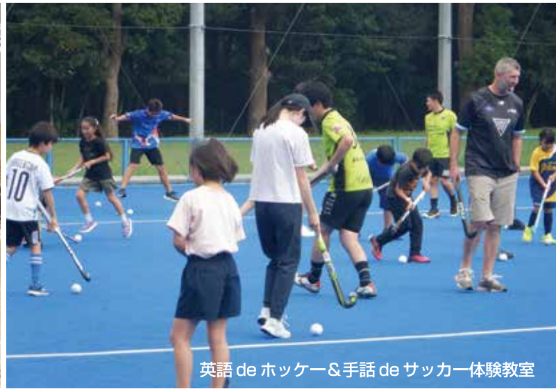
英語 de ホッケー & 手話 de サッカー体験教室